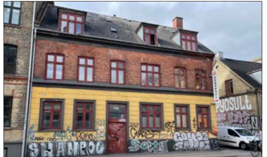
Boligbygningen fra 1892 på Nordre Fasanvej 273 skal nedrives