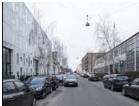
Rentemestervej ved Emaljehaven. Parkering i 4 rækker

Nedenfor ses arkitektfirmaet Adepts forslag til, hvorledes det altsammen kan løses. Bispebjerg Lokaludvalg har anmeldt denne projektskitse til forhandlingerne i kommunen for Budget 2025. Det vil være enormt meget lettere for alle parter, hvis de første skridt kunne tages, inden områdefornyelsen forsvinder om to år (tak til Adept).