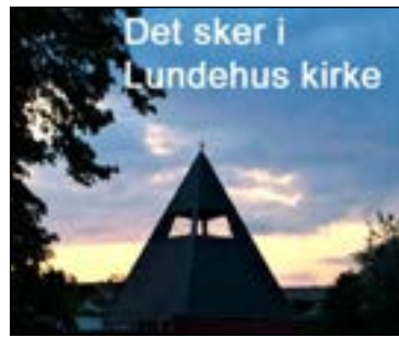
Af Ebbe Lauridsen Lundeus Kulturforsyning