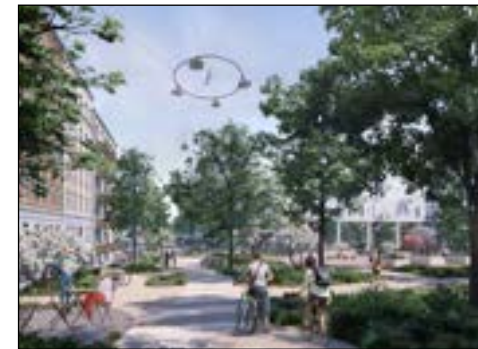
En vision for fremtiden

Der er finansiering til Emaljehavens forplads til højre i billederne nederst, men ikke til det såkaldte gågadeområde på Rentemestervej til venstre hvor man idag kan lande et mindre propelfly.