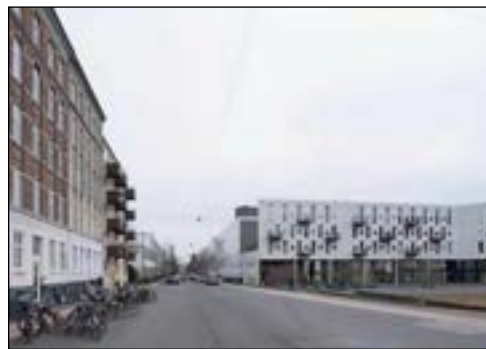
Rentemestervej ved Frederiksborgvej idag