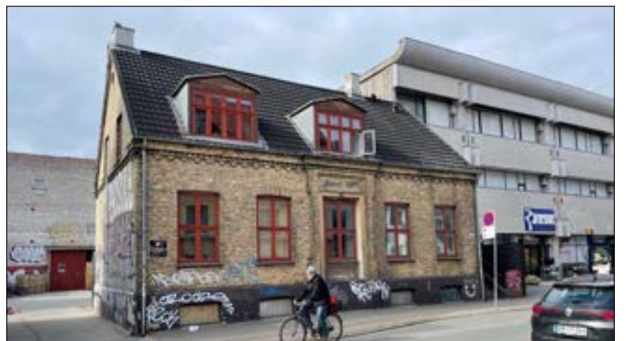
Det tidligere børneasyl fra 1889 forventes at få lov til at blive stående. Kommunen kan dog risikere at skulle overtage bygningen, hvis grundejeren ikke må nedrive.

I Københavns sammenhæng gør bygninger fra 1800-tallet nok ikke stort indtryk, men i Bispebjerg Bydel er der kun enkelte så gamle bygninger, så dem vil vi gerne passe på. Vi er meget tilfredse med, at der nu skal laves en bevarende lokalplan for karréen, der også rummer flere meget smukke bygninger fra starten af 1900 tallet.