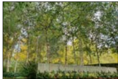
Den svenske Kirkegårdsafdeling