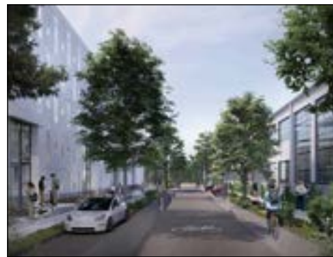
En fremtidig vision med cykelsti. Biler i 2 rækker